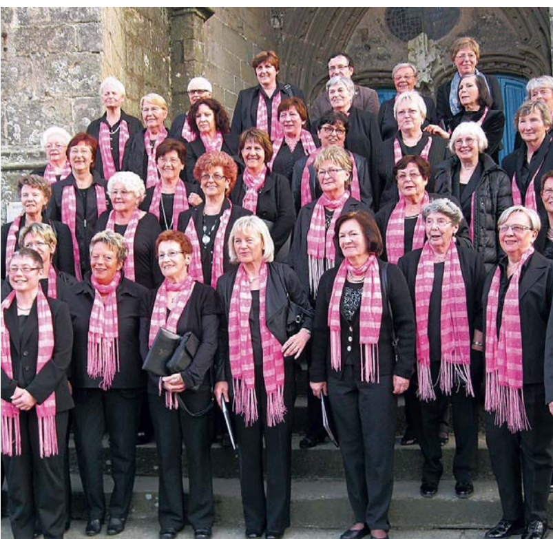
Der Homburger Frauenchor vor dem Konzert in der Kirche St. Gwénolé in Batz sur Mer in der Partnerstadt La Baule.